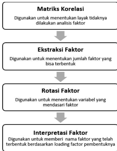
Gambar 1. Tahapan Analisis Faktor

penelitian ini yakni pada analisis faktor yang tahapannya dapat dilihat pada Gambar 1.