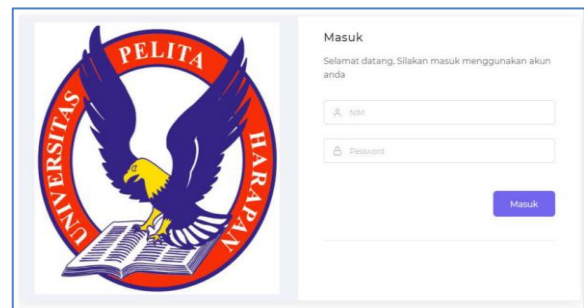
Gambar 2. Halaman Login

Tampilan halaman login merupakan tampilan yang muncul saat pertama kali user mengakses sistem yang dapat dilihat pada gambar 2.