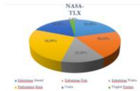
Gambar 2. Pie Chart hasil akhir NASA-TLX

Berdasarkan Rekapitulasi Hasil Perhitungan Nilai weighted workload (WWL) beban kerja mental operator RMGC ( Rail Mounted Gantry Crane ) di PT. IPC TPK Area Palembang jika disajikan dalam bentuk Pie Chart dapat dilihat pada gambar 2.