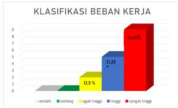
Gambar 1 Klasifikasi Beban Kerja Mental

Hasil perhitungan yang ditunjukkan pada tabel 6 dapat dilihat bahwa berdasarkan hasil perhitungan beban kerja mental yang telah dilakukan, beban kerja mental dengan indikator Kebutuhan Mental (KM) sebesar 3.730, Kebutuhan Fisik (KF) sebesar 3.670, Kebutuhan Waktu (KW) sebesar 2.410, Performansi Kerja (PK) sebesar 4.890, Usaha (U) sebesar 3.010 dan Tingkat Frustrasi (TF) sebesar 440. Pada hasil perhitungan rata-rata weighted workload (WWL) akan direkapitulasi, berikut rekapitulasi dari hasil perhitungan nilai WWL pada operator RMGC ( Rail Mounted Gantry Crane ) di PT. IPC TPK Area Palembang.