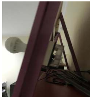
Gambar 3. Tampak Belakang Modul Trainer Panel Surya