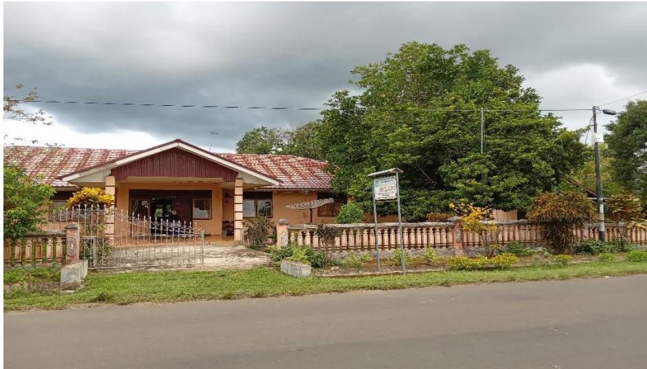
Gambar 2: Panti Asuhan Melati

Mitra pada kegiatan pengabdian kepada masyarakat ini adalah Panti Asuhan Melati beralamat di Jalan Husni Thamrin Rumah Tumbuh Blok I, Karang Anyar II Arga Makmur. Pada pelaksanaan kegiatan pengabdian kepada masyarakat, terdiri 9 orang remaja putri yang tinggal di panti asuhan melati dan berusia antara 13 s.d. 17 tahun.