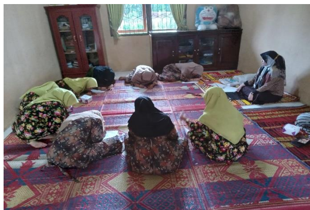
Gambar 3: Pelaksanaan Kegiatan Pengabdian Kepada Masyarakat