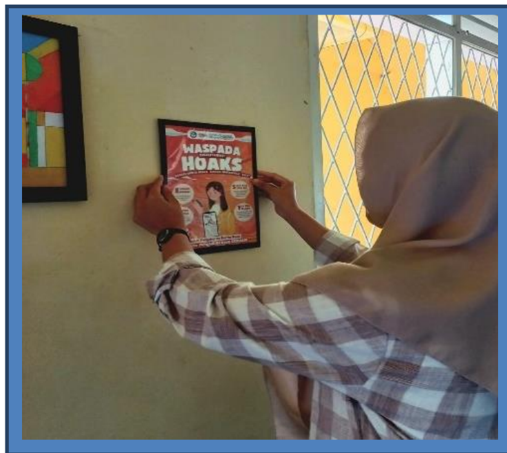
Gambar 4. Pemasangan Poster Anti-Hoax

Dalam kegiatan pembuatan poster ini, siswa diberikan kebebasan berekspresi secara kreatif dengan menggunakan Canva. Penulis hanya memberikan instruksi dan mendampingi. siswa didorong untuk dapat mengeksplorasi kreativitasnya dalam mengedit desain sesuai dengan imajinasi masing-masing. Canva menyediakan fitur-fitur yang bermanfaat bagi dunia pendidikan, antara lain sebagai media pembelajaran yang kreatif, inovatif, interaktif dan kolaboratif sehingga pembelajaran menjadi mudah, menyenangkan dan tidak membosankan (Abdillah et al., 2024; D. Y. Saputri et al., 2023). Hasil desain yang dibuat menggunakan Canva selanjutnya dapat disimpan dalam format PDF (Abdillah, 2012). Agar dapat dipasang, maka dapat dicetak sesuai dengan ukuran yang diinginkan. Kegiatan ini dapat melatih siswa membuat media pembelajaran berbasis digital menggunakan aplikasi Canva, hasilnya berupa poster yang dipasang di dinding sekolah (Gambar 4).