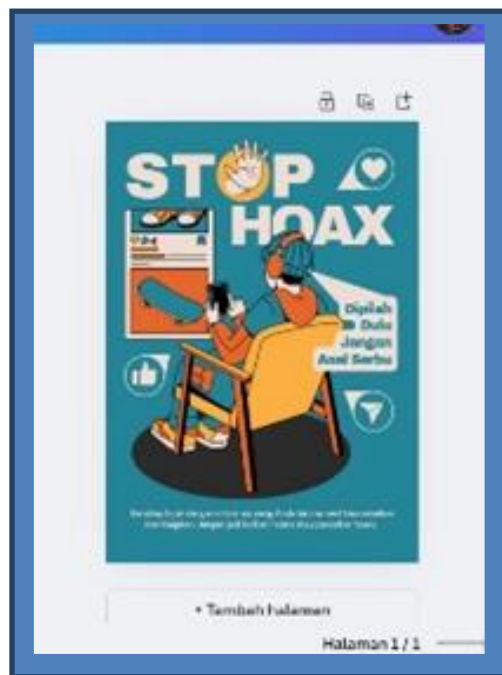
Gambar 3. Hasil Poster Menggunakan Canva

Literasi digital merupakan kemampuan seseorang dalam menggunakan perangkat dalam bentuk digital seperti gawai maupun komputer untuk mendukung aktivitas belajar atau pekerjaan (Abimanik et al., 2022; Setiawan et al., 2024). Penggunaan media desain grafis yang menarik dapat meningkatkan efektivitas penyampaian informasi pembelajaran agar siswa yang menerima informasi pembelajaran mudah dipahami. Penggunaan aplikasi Canva mampu meningkatkan kemampuan menulis dan membaca siswa yang disertai dukungan visualisasi sehingga menambah kreativitas siswa di era digital seperti program kampus mengajar yang meningkatkan mutu Pendidikan dalam literasi, numerasi dan adaptasi teknologi (D. Y. Saputri et al., 2023).